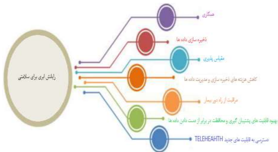
شکل ۱. مزایای کلیدی فناوری های مبتنی بر ابر در سیستم مراقبت های بهداشتی

RQ4 - شناسایی و بحث در مورد کاربردهای مهم رایانش ابری برای بهداشت و درمان.